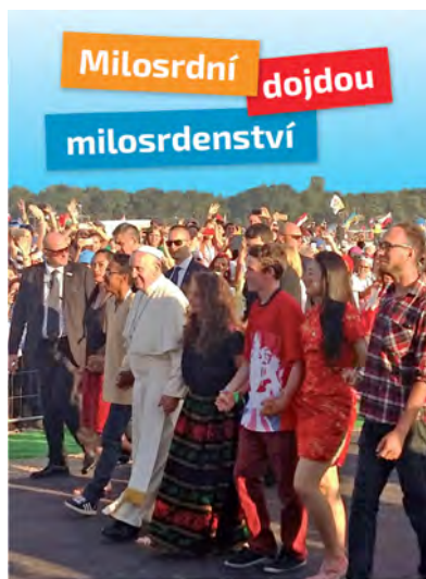
Světový den mládeže Krakov 2016

Kniha je k zakoupení v knihkupectví Paulínky a na DCM.